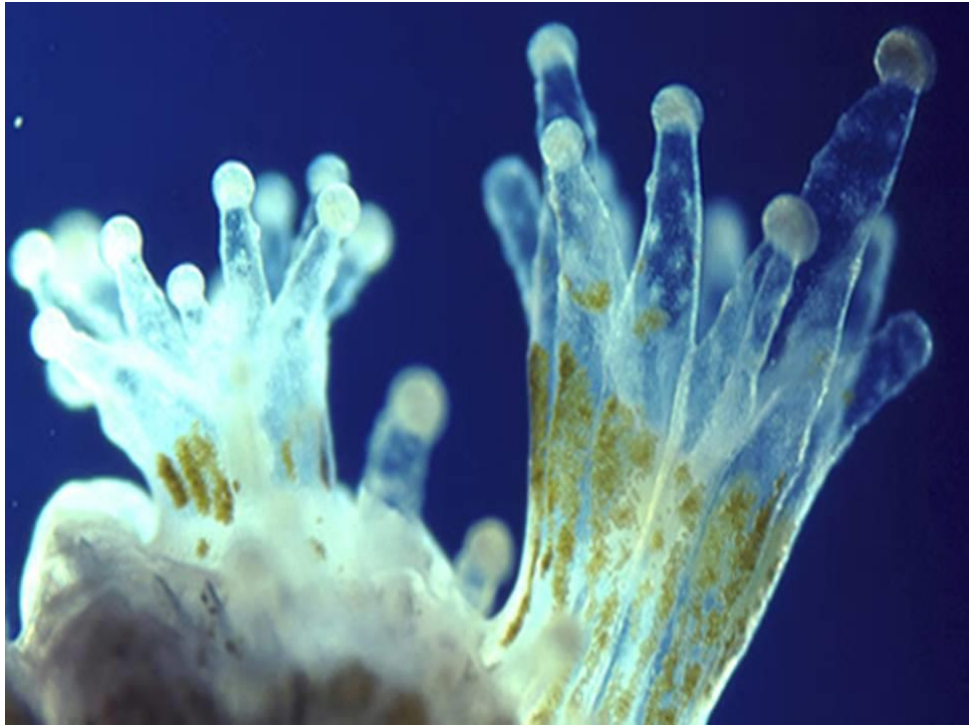
الطحلب داخل خلايا بوليبيات الشعاب المرجانية