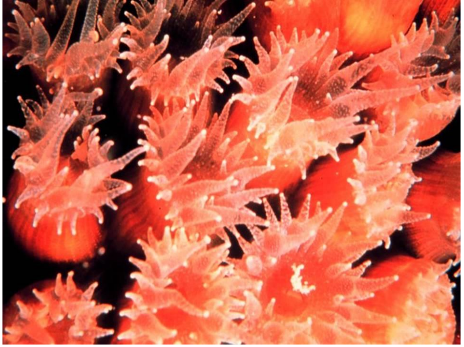
بعض اشكال البوليبيات لمستعمرات الشعاب المرجانية