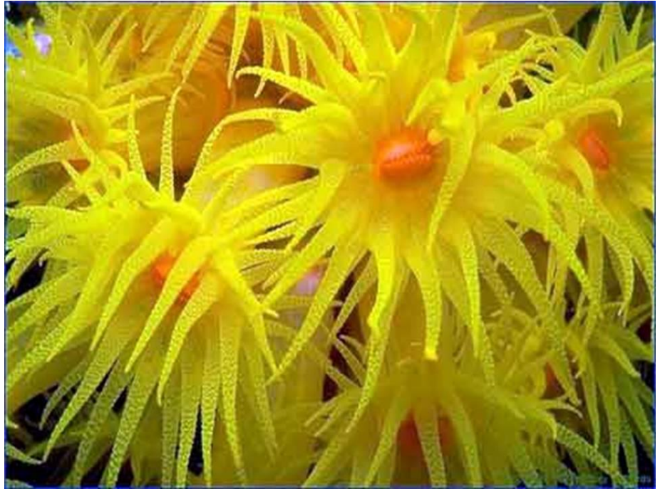
شكل آخر لبوليبيات الشعاب المرجانية